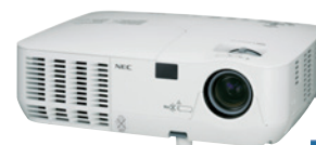
projektorem do bliskiej projekcji