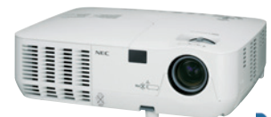
projektorem do bliskiej projekcji