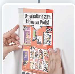
ODA4V (typ D)