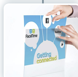
OUA4V (typ U)