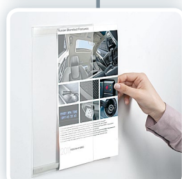
OCA4V (typ C)